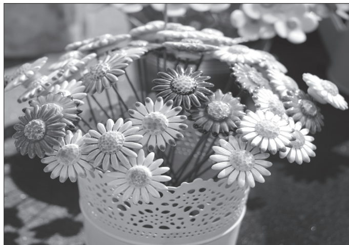
Hódít az új trend a lakberendezésben: a kerámiavirágok. Kép a Túri Vásár kavalkádjából.