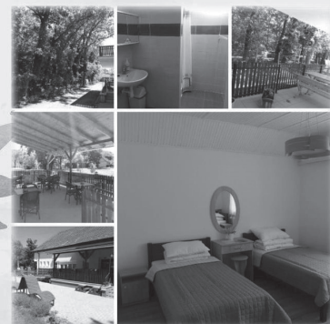
NTAK SZÁM: E619005204

Kérje egyedi ajánlatunkat a 0656/350-037-es telefonszámon és az intezmenyellato@mturiellato.hu email címen!